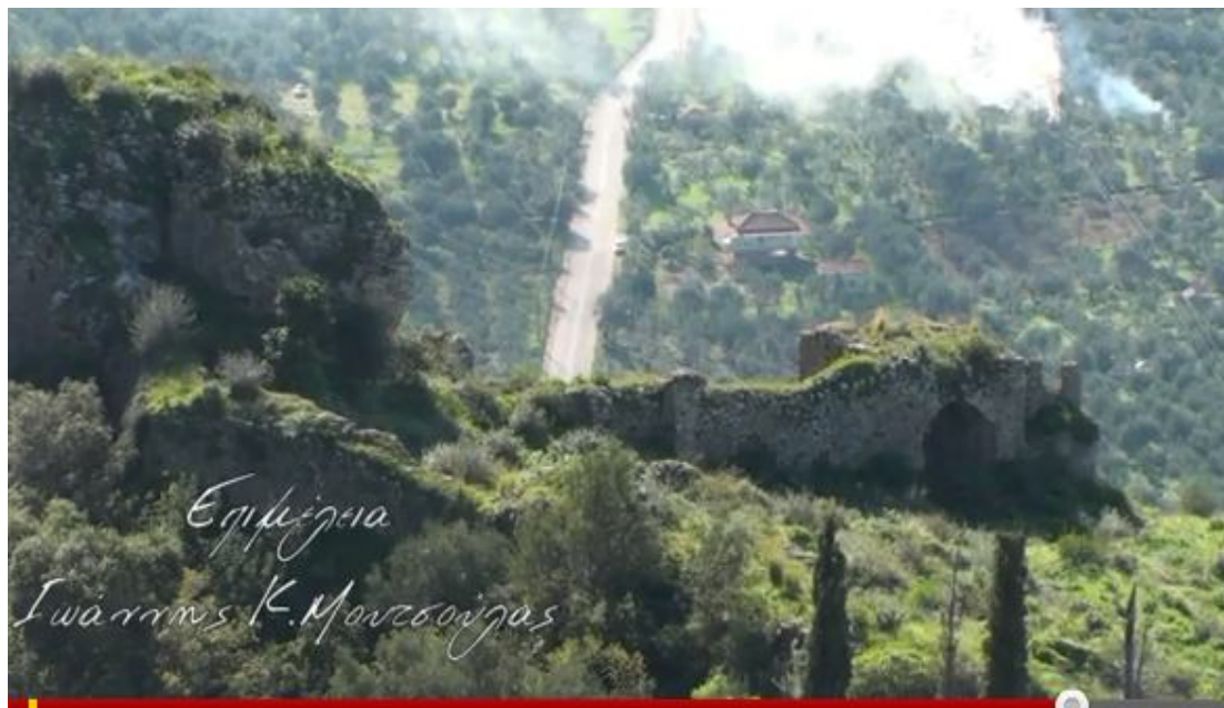
Τείχη του ενετικού κάστρου

Από το βυζαντινό κάστρο Πηδήματος σώζονται μέρη των τειχών του, η πύλη του, και τα χαμηλά ερείπια του ναΐσκου. Το κάστρο αυτό υπήρξε στερνό καταφύγιο της συνείδησης και της ανδρείας των υπερασπιστών του αλλά δεν άντεξε και κυριεύτηκε απ' τα στρατεύματα των Οθωμανών το 1460.