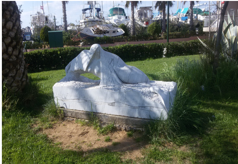
φωτογραφία του έργου «Ξωτικό της θάλασσας»

ΘΕΜΑ: Μεταφορά του έργου «Ξωτικό της θάλασσας» του Διονύση Γερολυμάτου που δημιουργήθηκε στα πλαίσια του συμποσίου γλυπτικής Καλαμάτα 2000 από την Μαρίνα Καλαμάτας στην δυτική παραλία (σε μικρή απόσταση από το νότιο πεζοδρόμιο της Ναυαρινου ,με έδραση του στα βότσαλα).