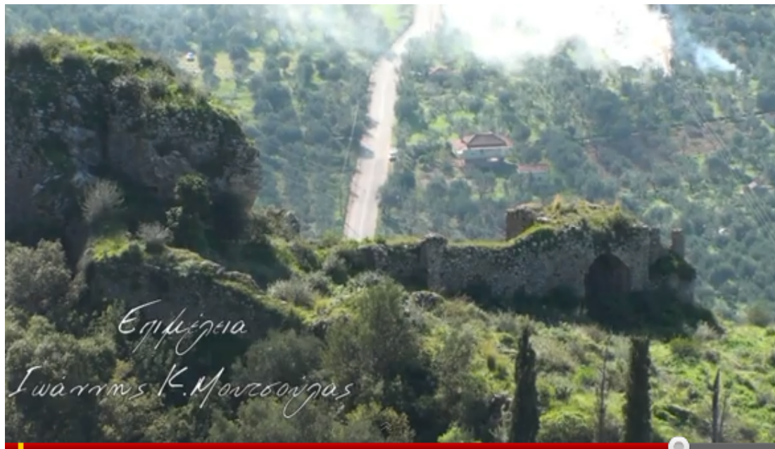
Τείχη του ενετικού κάστρου

Από το βυζαντινό κάστρο Πηδήματος σώζονται μέρη των τειχών του, η πύλη του, και τα χαμηλά ερείπια του ναΐσκου. Το κάστρο αυτό υπήρξε στερνό καταφύγιο της συνείδησης και της ανδρείας των υπερασπιστών του αλλά δεν άντεξε και κυριεύτηκε απ' τα στρατεύματα των Οθωμανών το 1460.