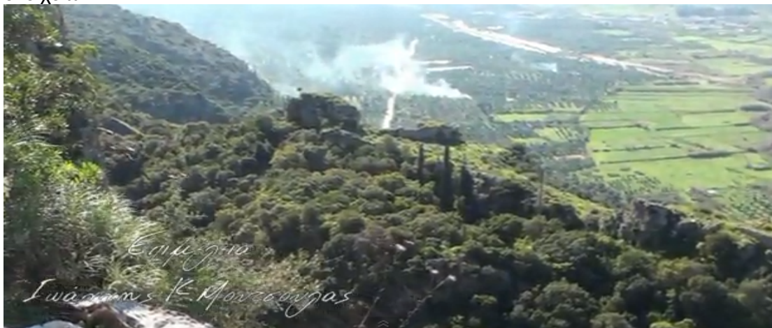
Το μονοπάτι στο άνω τμήμα προσφέρει πανοραμική θέα