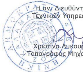
Χριστίνα Λυκουργιά Τοπογράφος Μηχανικός