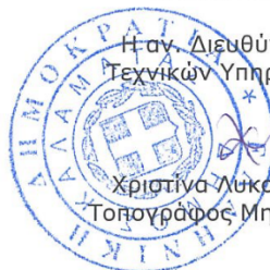
Χριστίνα Λυκούργια Τοπογράφος Μηχανικός