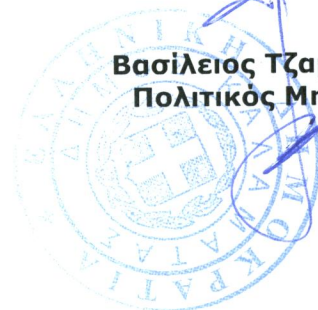
Βασίλειος Τζαμουράνης Πολιτικός Μηχανικός