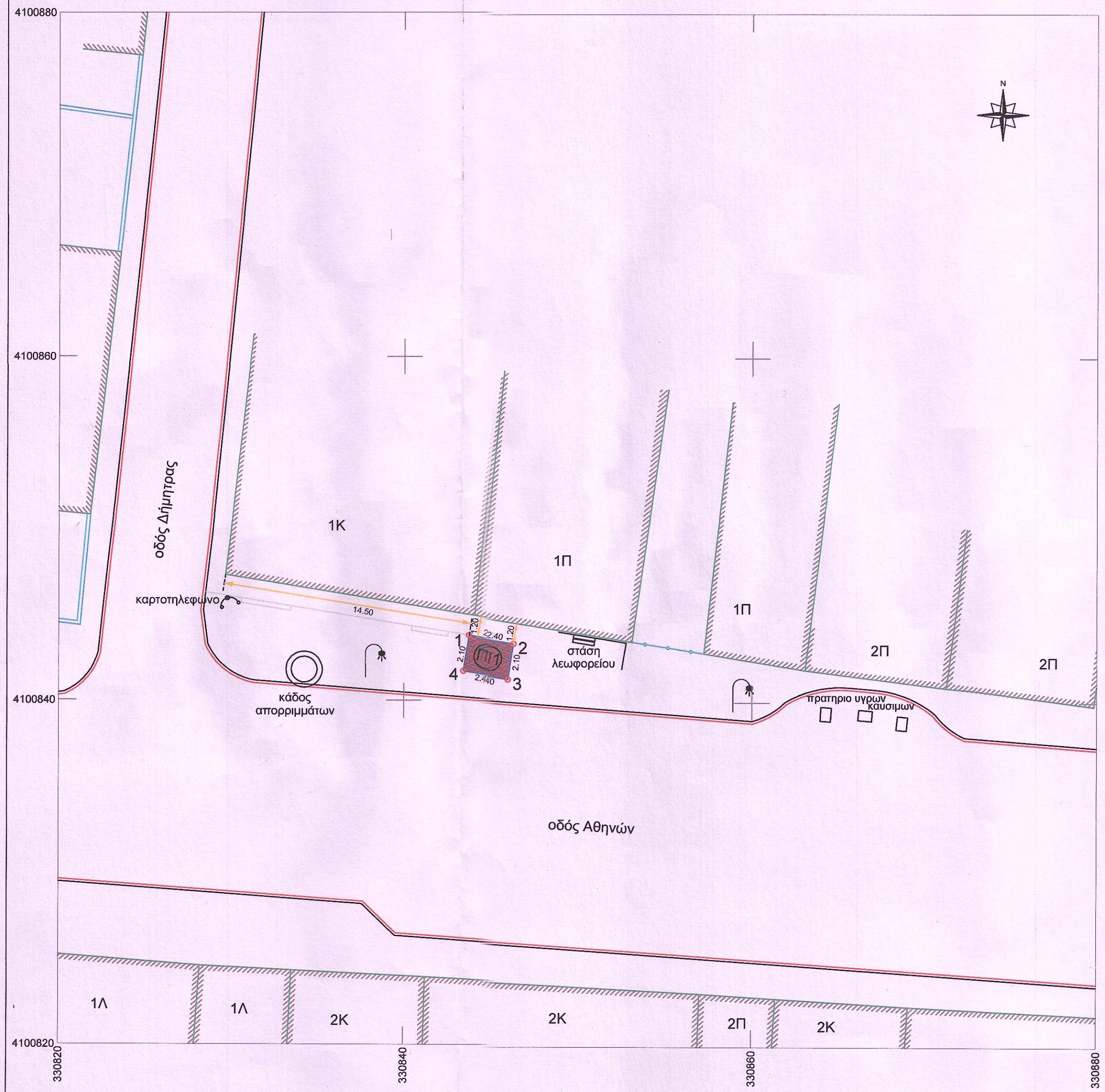
ΑΠΟΣΠΑΣΜΑ ΧΑΡΤΗ ΚΤΗΜΑΤΟΛΟΓΙΟΥ ΚΛΙΜΑΚΑ 1/1000 - Θέση Περιπτέρου