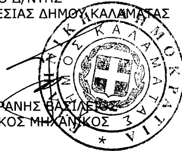
ΤΖΑΜΟΥΡΑΝΗΣ ΒΑΣΙΛΕΙΟΣ ΠΟΛΙΤΙΚΟΣ ΜΗΧΑΝΙΚΟΣ

ΘΕΩΡΗΘΗΚΕ 4/12/2014 Ο Δ/ΝΤΗΣ ΤΕΧΝΙΚΗΣ ΥΠΗΡΕΣΙΑΣ ΔΗΜΟΥ ΚΑΛΑΜΑΤΑΣ